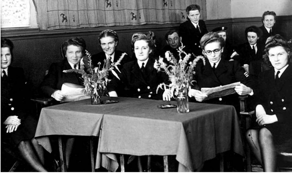
Podoficer i marynarze (ochotniczki) PMSK

obowiązywały takie jak w wojskach lądowych i lotnictwie. Nazwy stopni w PWSK i PLSK do stopnia kapitana włącznie odpowiadały stopniom w wojskach lądowych i lotnictwie. Tylko stopnie wyższe otrzymały inne nazwy: młodsza inspektorka — odpowiednik stopnia majora, inspektorka — podpułkownika i starsza inspektorka — pułkownika. Jednak rozkaz z 30 czerwca 1945 r. ustalił i dla tych stopni tradycyjne nazwy: major, podpułkownik i pułkownik.