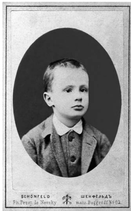
Kazimierz Porębski, Wilno ok. 1880