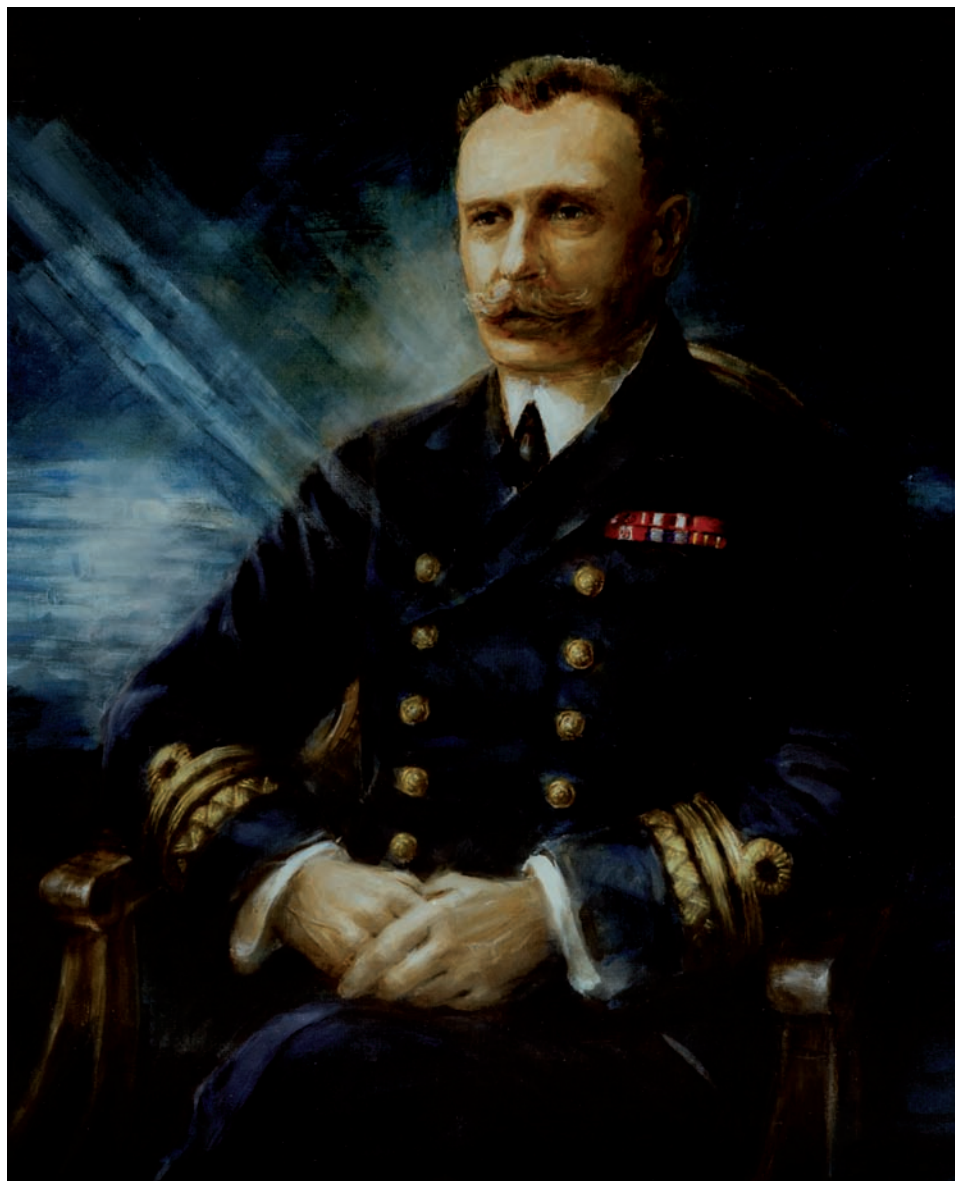
Wiceadmirał Kazimierz Porębski (15 IX 1872–20 I 1933), obraz Grażyny Kilarskiej