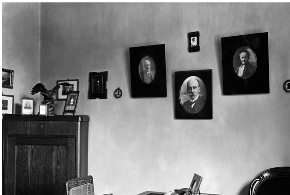
Portrety ścienne przodków admirała Kazimierza Porębskiego