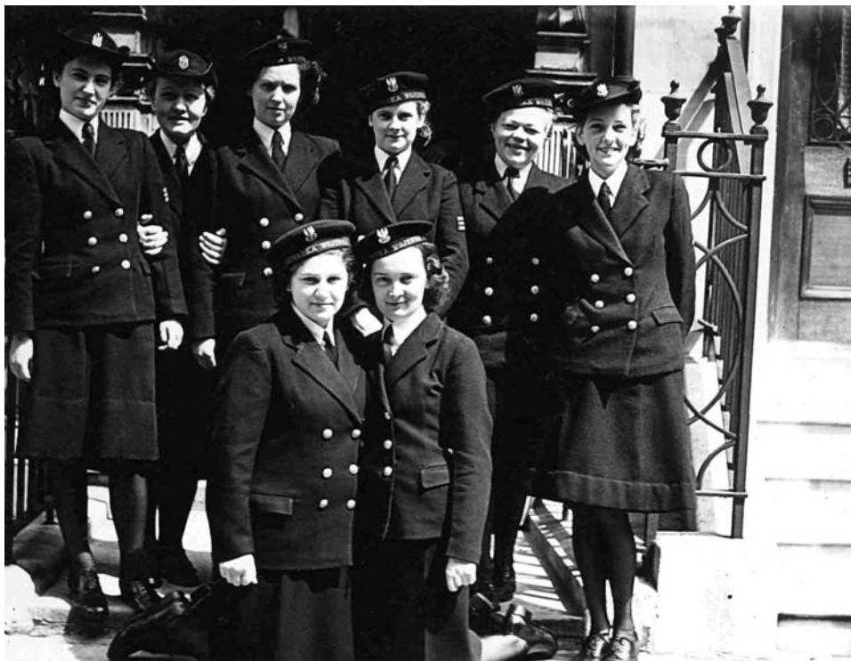
Oficerowie, podoficerowie i marynarze PMSK

W sierpniu 1945 r. zostały utworzone oddziały PMSK w Obozie ORP „Bałtyk” i w Centrum Wyszkozenia Specjalistów Floty 28 . W skład oddziału w ORP „Bałtyk” weszli żołnierze PMSK zatrudnieni w biurach i na kursach prowadzonych w Obozie ORP „Bałtyk” i w Szkole Podchorążych Marynarki Wojennej; w Centrum Wyszkozenia Specjalistów Floty, ochotniczki zatrudnione w biurach i na kursach w Komendzie Morskiej Południe, Komendzie Uzupelnień Floty, Centrum Wyszkozenia Specjalistów Floty i w innych jednostkach MW stacjonujących w Devonport i w pobliżu tej miejscowości.