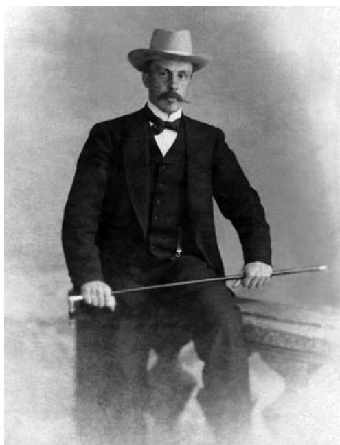
Adolf Porębski (ok. 1830–ok. 1886)